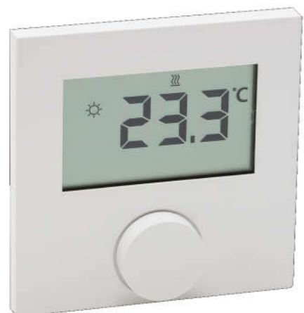
Thermostaat verwarmen LCD 24V