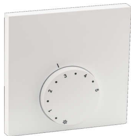
Thermostaat verwarmen Analooq 24V

21 x aansluiting t.b.v. servomotor (max 3W)